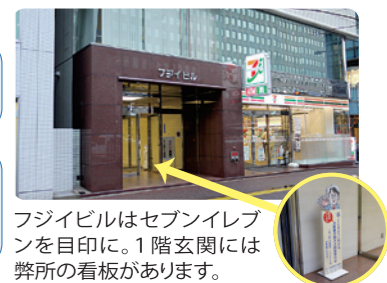
フジビルはセブンイレブンを目印に。1階玄関には弊所の看板があります。

駐車場② 50分100円・5台/12台 広瀬病院横の路地沿いです。渡辺通り側に5台、その奥に12台あります。