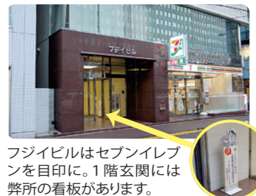
フジビルはセブンイレブ ンを目印に。1階玄関には 弊所の看板があります。

駐車場① 50分100円・28台 桜十字病院側から入るほうが停めや すいです。 駐車場② 50分100円・5台/12台 広瀬病院横の路地沿いです。渡辺通り 側に5台、その奥に12台あります。