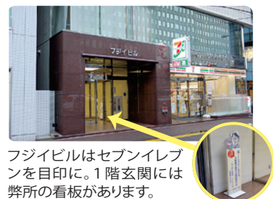
フジビルはセブンイレブンを目印に。1階玄関には弊所の看板があります。

駐車場② 50分100円・5台/12台 広瀬病院横の路地沿いです。渡辺通り側に5台、その奥に12台あります。